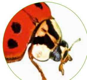
„W“ auf dem Kopfschild